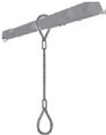
Appendimento singolo verticale